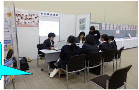
5/7 看護師就職ガイダンス 石川県地場産業振興センター