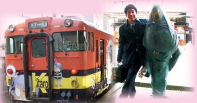
▲JR西日本が境港~米子間で運行している「妖怪列車」

境港市の取り組みは、道路・記念館などのハード整備だけではなく、「妖怪検定」や「妖怪列車」、「妖怪そっくりコンテスト」など民間企業・地域住民も巻き込んで、マンガを用いたまちづくりを進めています。