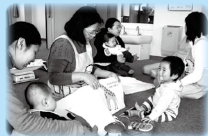
～乳幼児健康相談でのボランティア様子～