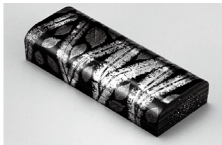
銀葉文螺鈿箱「枝折り葉」