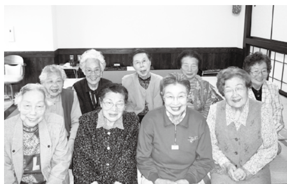
▲ふれあいプラザ二勢「ほほえみ教室」に参加している皆さん