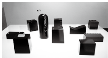
「日のはじまり」平成20年(2008) / 中村有希 作

6月7日(土)、8日(日)の2日間「輪島市民まつり2008」に協賛して、市民の皆さま対象に無料開放いたします。