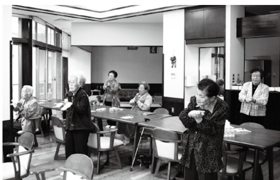
▲体操をしている様子

介護予防という言葉をご存じですか？介護予防とは、高齢になっても介護が必要とならないように、たとえ介護が必要になっても、それ以上悪化しないようにすることです。元気な今のうちから始めることが大切です。介護予防とは、特別なことではありません。日常生活を活発にし、自分にできることの範囲を広げ、生きがいや目標を持って、前向きに暮らしていくことです。自分らしく、生き生きと生活できるように、心身の老化を防ぐ介護予防を始めましょう。今回は介護予防教室をご紹介します。